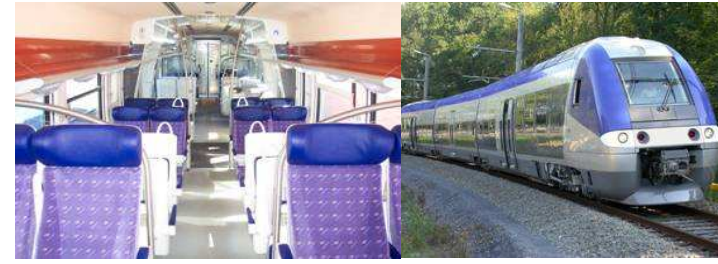
Le nouveau matériel moderne sur la ligne